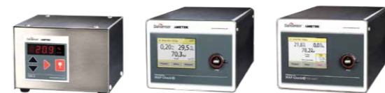
Dansensor ISM-3 Dansensor MAP Check 3 Dansensor MAP Check 3 Vacuum

Готові до контролю якості? Забезпечте цілісність бренду, контролюючи КОЖНЕ пакування. Онлайн МГС-тестування оптимізує використання газу та усуває марну трату грошей, часу та матеріалів на перепакування.