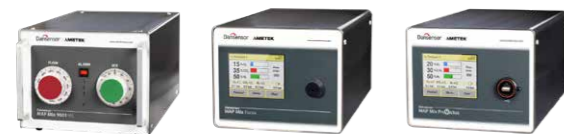
Dansensor MAP Mix 9001 ME Dansensor MAP Mix Focus Dansensor MAP Mix Provectus

Отримайте правильний склад з самого початку! Наша серія MAP Mix забезпечує точне змішування газів під час процесу заправки. Опції для змішування N 2 , O 2 , CO 2 та Ar.