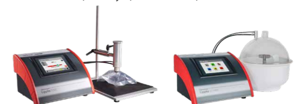
Dansensor Lippke 5000 Dansensor Lippke VC1400

Ідеально підходять для розробки і тестування пакування в лабораторії. Наші прилади Lippke® відповідають суворим стандартам тестування фармацевтичних пакувань, а також харчової промисловості. Виміряйте всі аспекти міцності ущільнення і цілісності пакування.