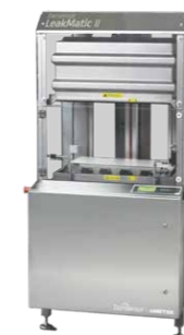
Dansensor LeakMatic II

Працюєте на високих швидкостях? Забезпечте безперервну, повністю автоматичну перевірку герметичності в лінії. Переконайтеся, що кожна коробка робить ваш бренд привабливим!